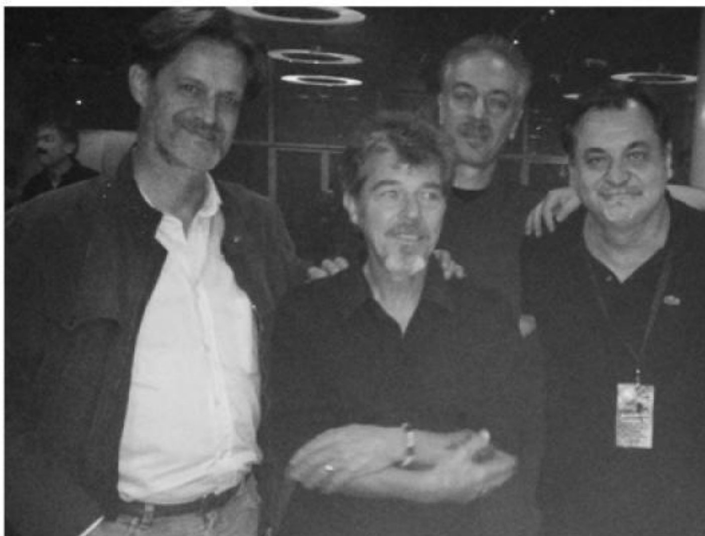
P.LION / KEN LASZLO / ROBERTO TURATTI

do che nella musica, a parte un minimo di talento nel cantare o nel suonare uno strumento, occorrono due cose: cuore e passione. Se parti con l'idea di fare un successo a tavolino, non vai da nessuna parte, perché non realizzerai nulla di originale. I pezzi e i fenomeni che attualmente «spaccano» sono quelli che producono un'emozione particolare. Oggi poi che non si vende un disco, la situazione è diventata ancora più difficile. Ci sono in giro migliaia di prodotti, ma con Internet la distribuzione dei supporti è diventata qualcosa di inutile. Chiunque può pubblicare sulle varie piattaforme digitali, ma con il risultato che non si vende più nulla o quasi.