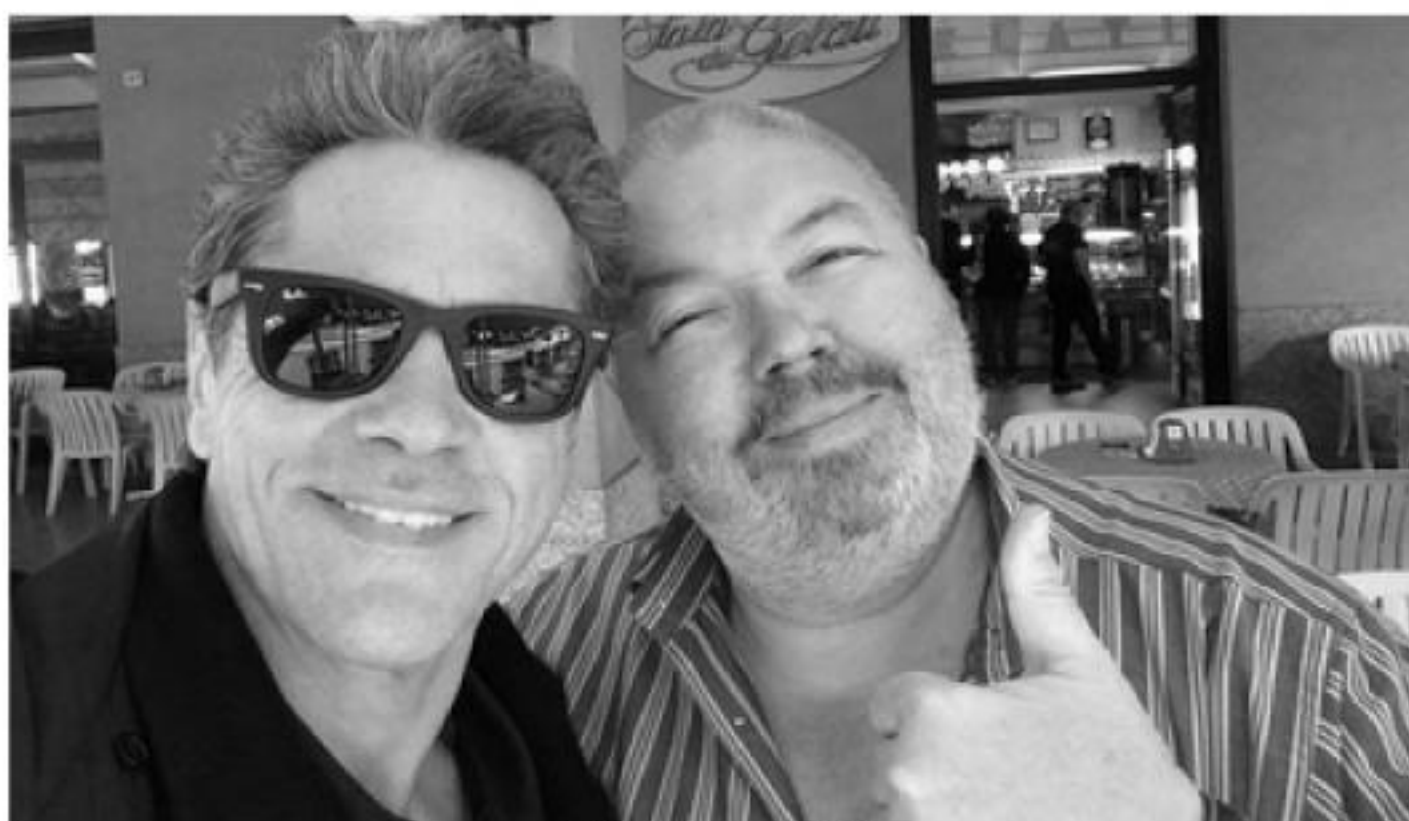
GAZEBO E ALBERT ONE

D. In Italia non esistono settori in cui non vi siano rancori o invidie. Pensiamo alle situazioni politiche che si vedono in circolazione che sono davvero una vergogna e rispecchiano quella che è una mentalità tipicamente italiana.